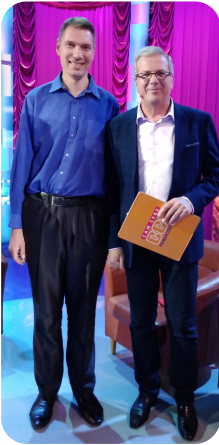
Попав на ТВ? Легко и просто!

Уже не первый десяток лет выходит в свет юмористическое шоу «Сам себе режиссер» с бессменным ведущим